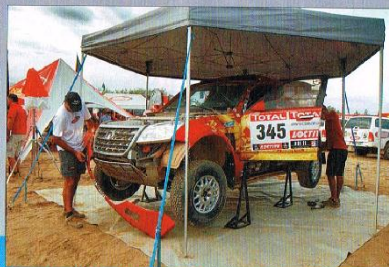
Grâce à SMG, les Great Wall Haval ont bénéficié d'une équipe d'assistance rodée et efficace.

d'eau et d'huile. Les dunes de Fiambala étaient cette année très faciles, à cause des pluies récentes. Au Chili, rien à signaler. Il n'y a qu'une seule mauvaise journée, lors de la première spéciale au Pérou : là, nous nous sommes plantés et replantés plusieurs fois, ce qui nous a fait perdre une cinquième place possible. Mais les Chinois n'étaient pas du tout déçus de cela, ce qui leur importait était que nous finissions le rallye dans les dix premiers. De quoi pouvoir convaincre leur direction que leurs voitures sont efficaces, mais qu'il y a encore une progression possible : c'est toute la subtilité de la psychologie asiatique, qu'il faut un peu comprendre pour pouvoir bien travailler avec eux... ■